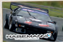
BMW M 1 – ein Auto der Superlative aus den 70ern