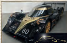
Original Le Mans Sportwagen LMP – im Design des Jubiläumsbergrennens