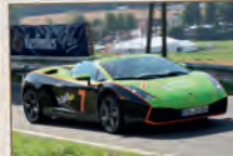
Lamborghini Gallardo – ein italienischer Supersportwagen mit Speed & Sound