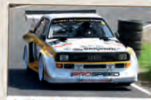
Audi S 1 Ur-Quattro – das bärenstarke Fahrzeug mit Kultcharakter und großen Emotionen