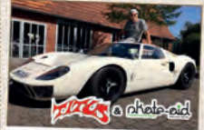
Ford GT 40 – der wohl erfolgreichste Rennwagen der 60er