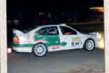
Skoda Octavia WRC – im internationalen Rallyesport zu Beginn der 2000er erfolgreich